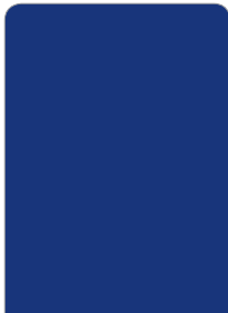
Blue 942-1051 Azul