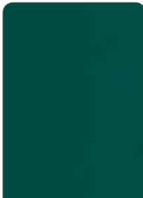
Green 942-1055 Verde