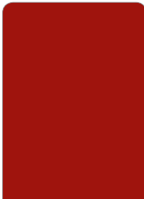
Red 942-1065 Rojo

Other colors on demand Disponibilidad de otros colores bajo demanda